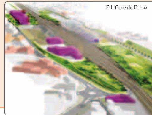
PIL Gare de Dreux